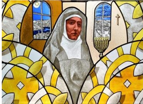
Edith Stein, Sr. Theresia Benedicta vom Kreuz. Detail aus einem Glasfenster in der Pfarrkirche St. Wolfram in Wadgassen

Wir gedenken dieser klugen, tapferen und heiligen Frau, die am 9. August vor 84 Jahren zusammen mit ihrer Schwester im KZ Auschwitz-Birkenau ermordet wurde.