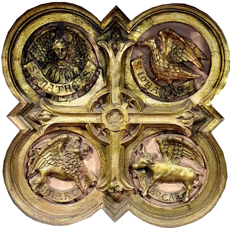
Tetramorph von Differten

Redaktionsschluss für Ausgabe 06/2026 (15.08.-13.09.): 24.07.2026