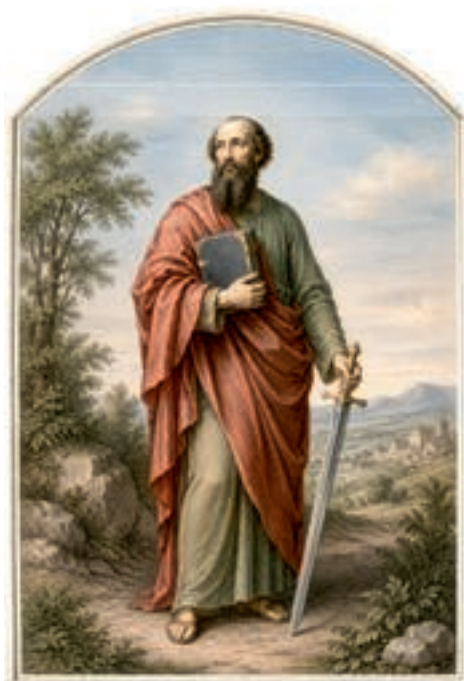
Heiliger Paulus von Tarsus

Petrus und Paulus waren sehr unterschiedliche Persönlichkeiten: Die Kirche sieht in beiden gemeinsam die zwei Grundpfeiler: Während Petrus für die Einheit und Kontinuität der Kirche steht, verbindet man mit Paulus die Verkündigung und die Mission. Nicht zuletzt darum werden sie seit der frühen Kirche gemeinsam verehrt. Während Petrus als Fischer, Jünger Jesu von Anfang an war, vereinigt er in seiner Person auch das Symbol der Einheit und des Amtes. Er wirkte vor allem unter Juden. Paulus war Gelehrter. Er