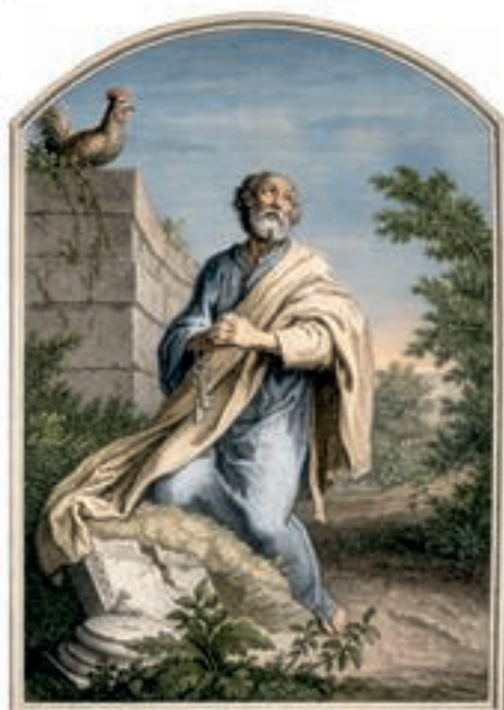
Heiliger Simon Petrus